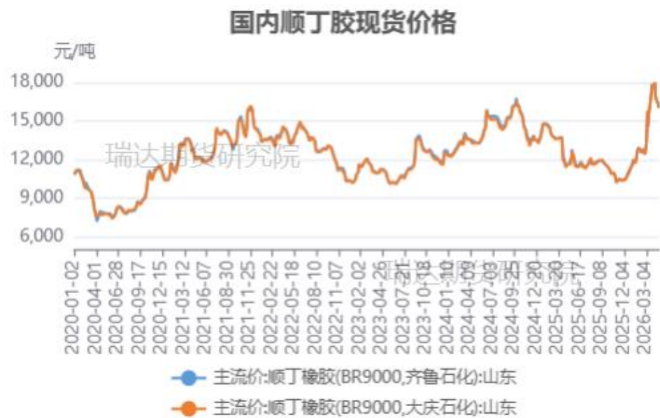
顺丁橡胶现货市场价格走势