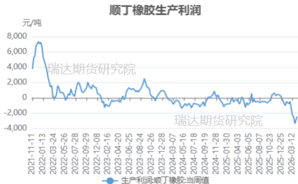
顺丁橡胶生产利润