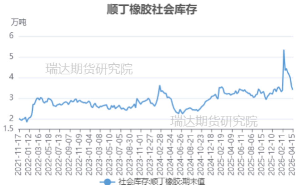
顺丁橡胶社会库存