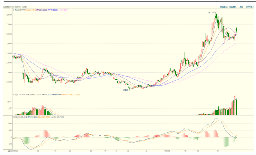
合成橡胶期货主力合约价格走势