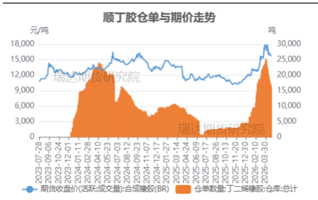
合成橡胶期价与仓单变化对比