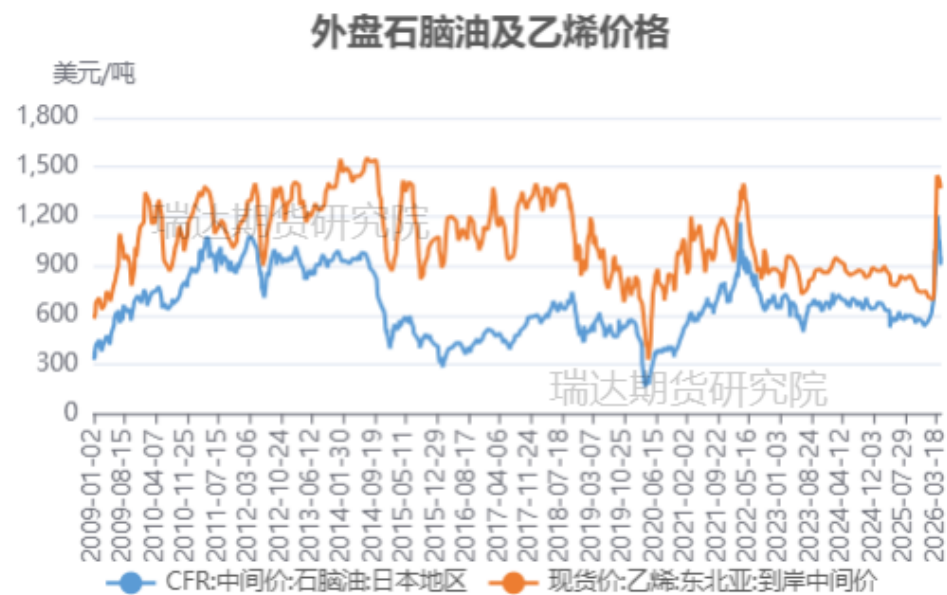
外盘石脑油及乙烯价格走势