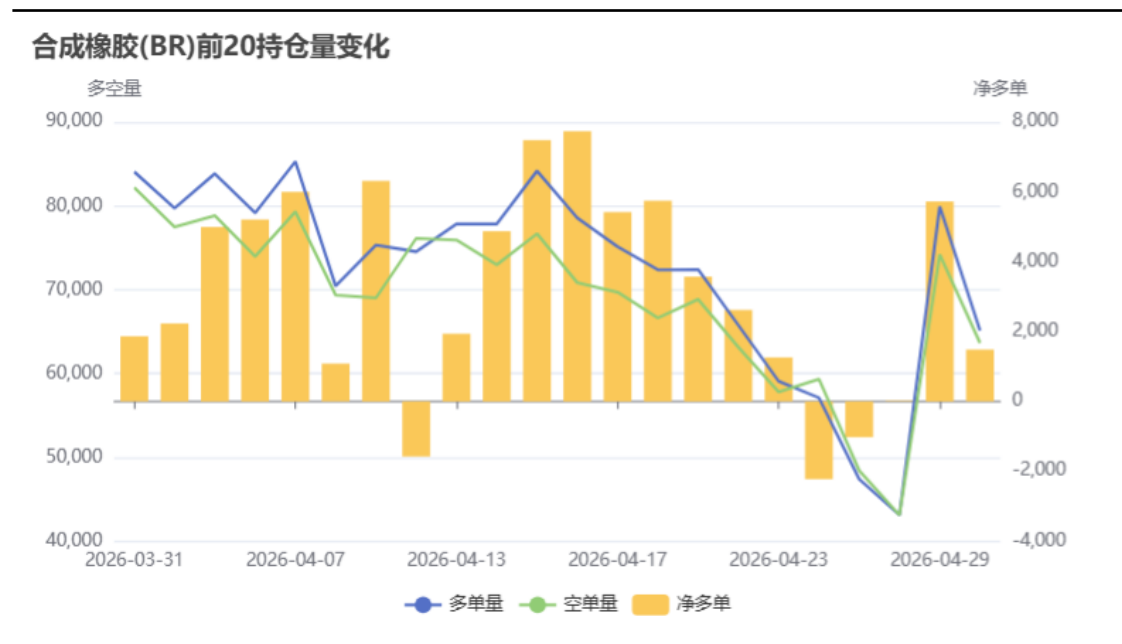
顺丁橡胶前20名持仓变化