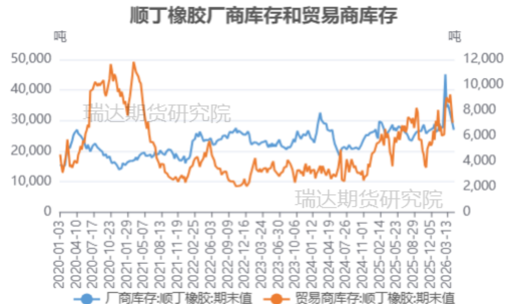
顺丁橡胶厂商库存和贸易商库存