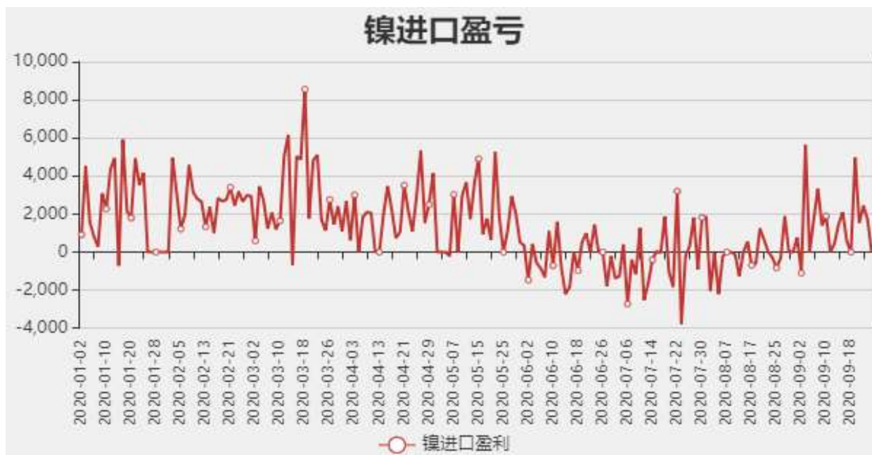
图5：镍进口盈亏分析

截止至2020年09月18日，全国主要港口统计镍矿库存为772.64万吨，较上周增加16.44万吨。截止至09月25日，菲律宾镍矿:Ni:1.5-1.6Fe:25-30%:华东价格为675元/吨。