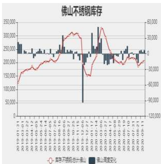
图7：佛山不锈钢月度库存