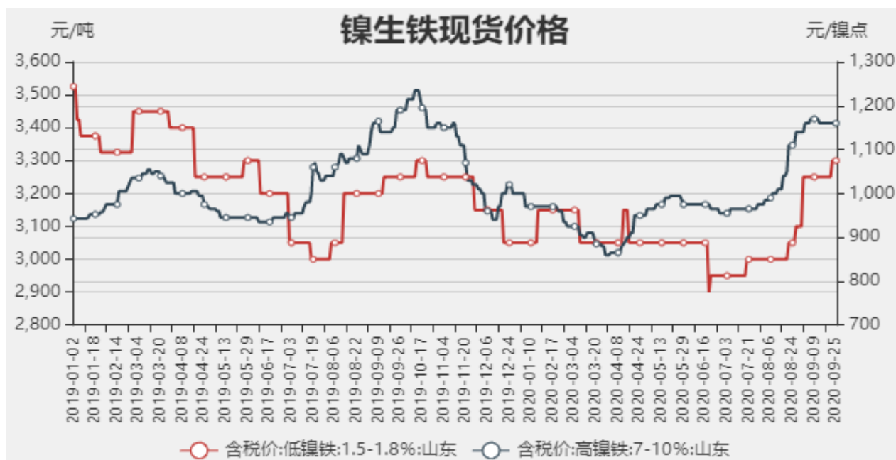
图1：镍生铁现货价格

截止至2020年09月25日，以山东地区为例，低镍铁（FeNi1.5-1.8）价格为3300元/吨，较上周上涨50元/吨，高镍生铁（FeNi7-10）价格为1160元/镍点，较上周持平。