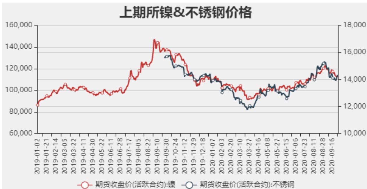
图2：国内镍现货价格

截止至2020年09月25日，沪镍期货价格为113610元/吨，不锈钢期货价格为14330元/吨。