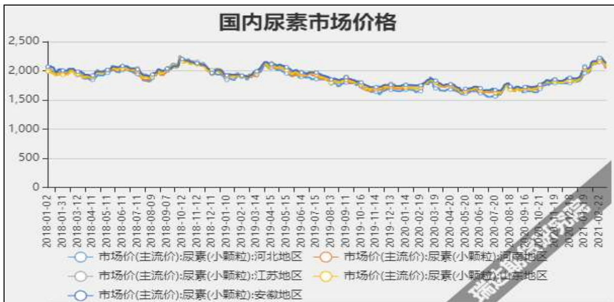
图3 国内尿素市场主流价

截至3月18日，NYMEX天然气收盘价2.48美元/百万英热单位，较上周-0.19美元/百万英热单位。