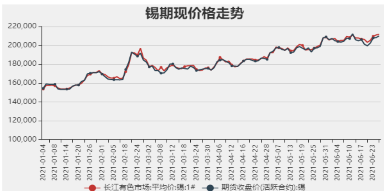
图1：国内锡现货价格

截止至2021年6月25日，长江有色市场1#锡平均价为211750元/吨，沪锡期货价格为209900元/吨。