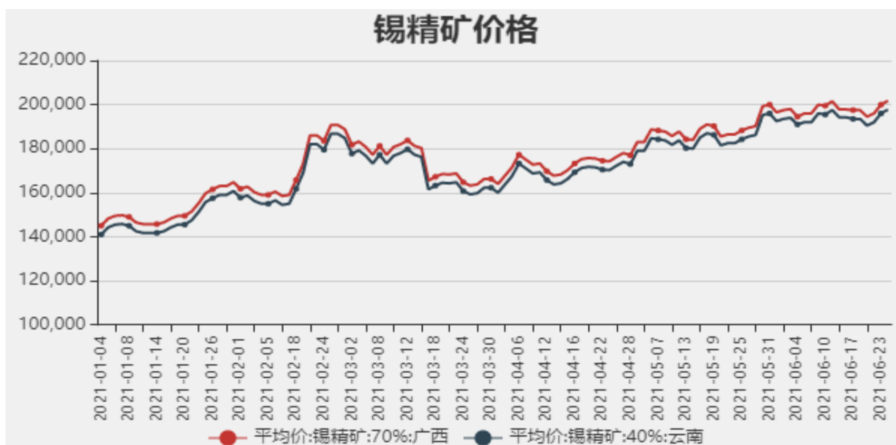
图2：国内锡精矿价格

截止2021年6月24日，国内广西锡精矿70%价格为201750元/吨，云南锡精矿40%价格为197750元/吨。