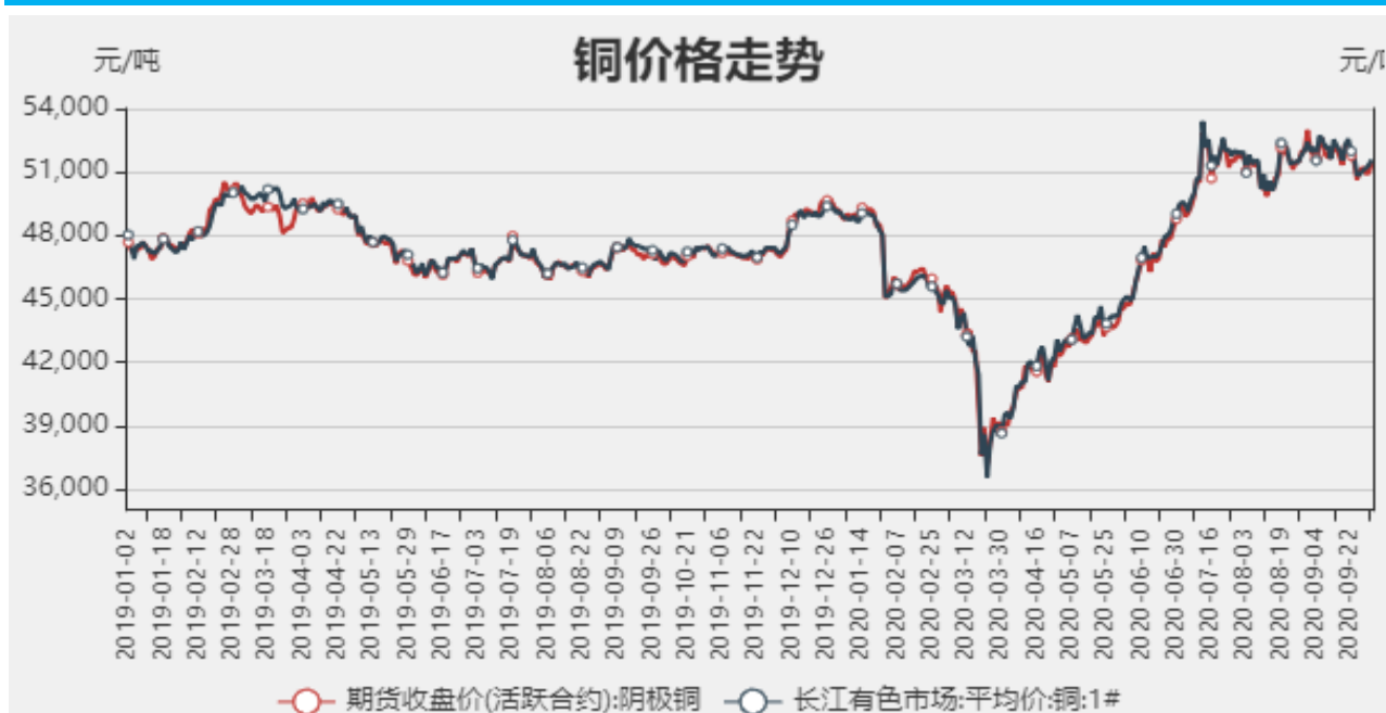
图1：铜期现价格走势

截止至2020年10月09日，长江有色市场1#电解铜平均价为51440元/吨；电解铜期货价格为51590元/吨。