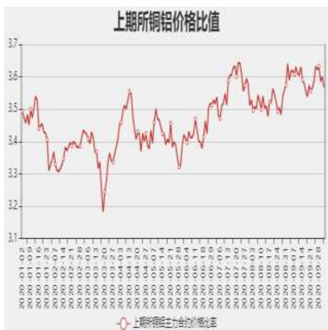
图9: 沪铜和沪铝主力合约价格比率