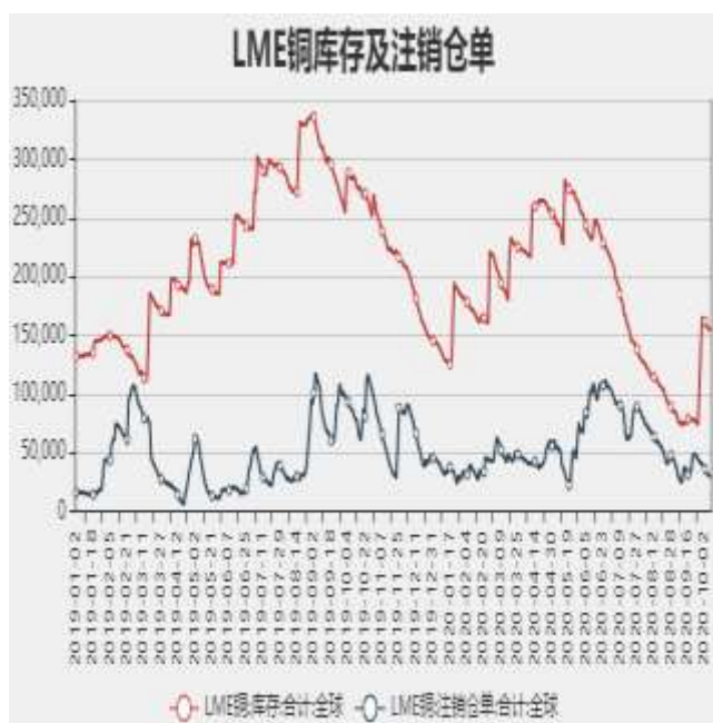
图7: LME铜库存及注销仓单