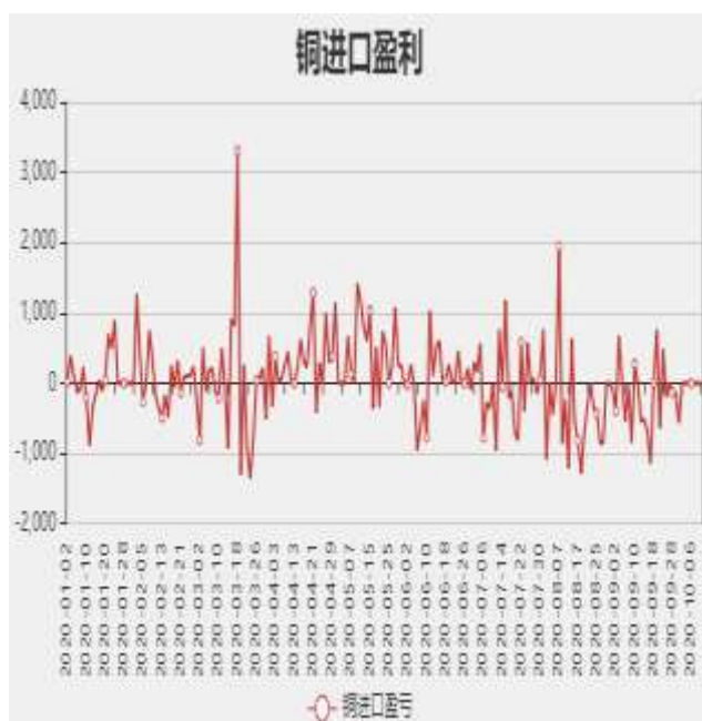
图3：精炼铜进口利润