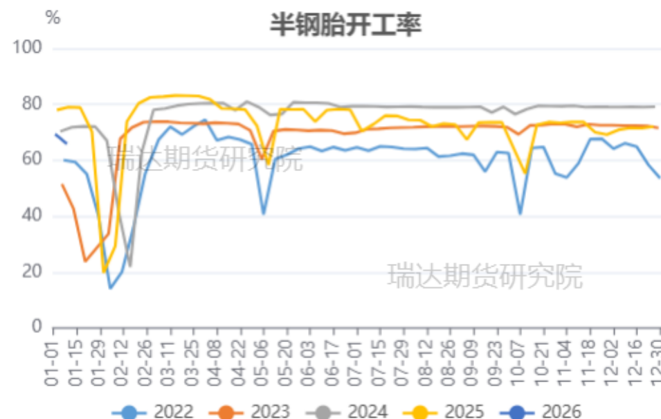
国内半钢胎开工率