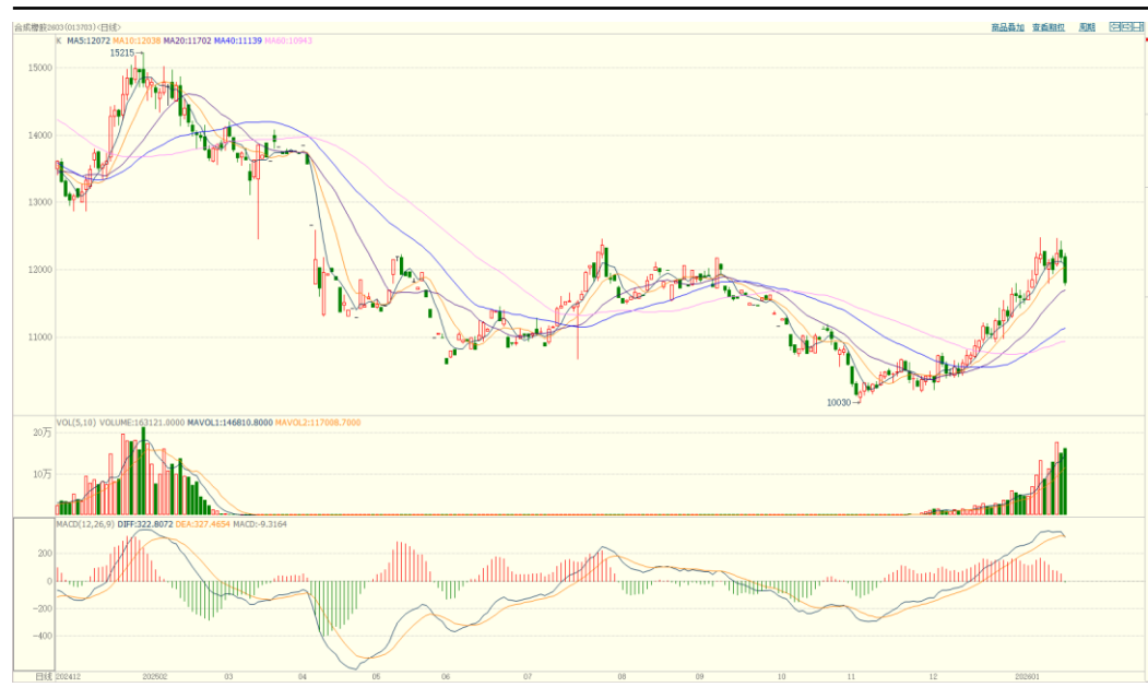
合成橡胶期货主力合约价格走势