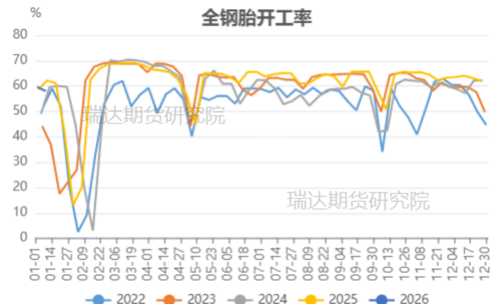
国内全钢胎开工率