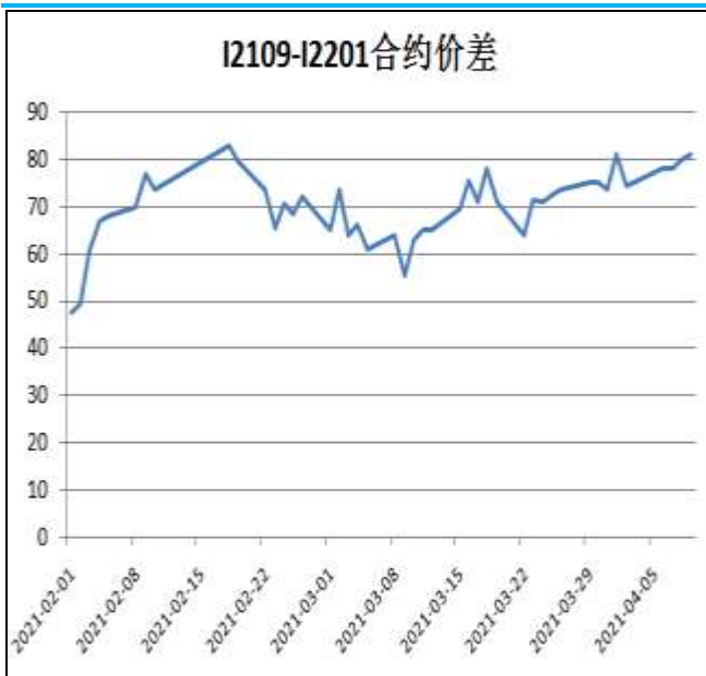
图5：铁矿石跨期套利

本周，I2109合约走势强于I2201合约，9日价差为81元/吨，周环比+6.5元/吨。