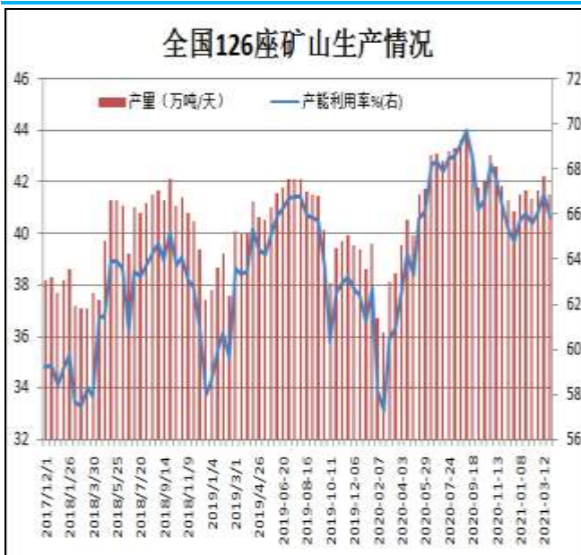
图13: 全国126座矿山产能利用率

据Mysteel统计，截止3月26日全国126矿山样本产能利用率为65.85%，环比上期调研降1.08%；库存130.75万吨，增19.5万吨。