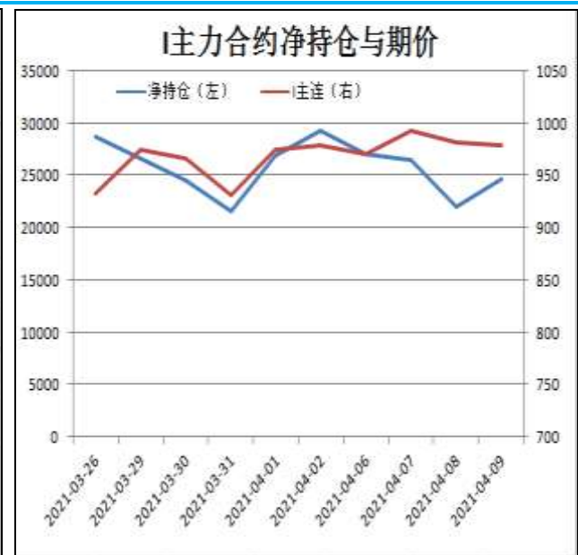
图14: 铁矿主力合约前20名净持仓

I2109合约前20名净持仓情况，2日为净多29241手，9日为净多24656手，净多减少4585手，由于主流持仓空单增幅略大于多单。