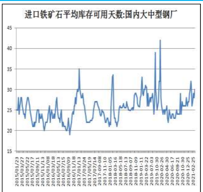
图10：钢厂铁矿石可用天数

8日Mysteel统计64家钢厂进口烧结粉总库存1801.69；烧结粉总日耗54.49；库存消费比33.07，进口矿平均可用天数29天。