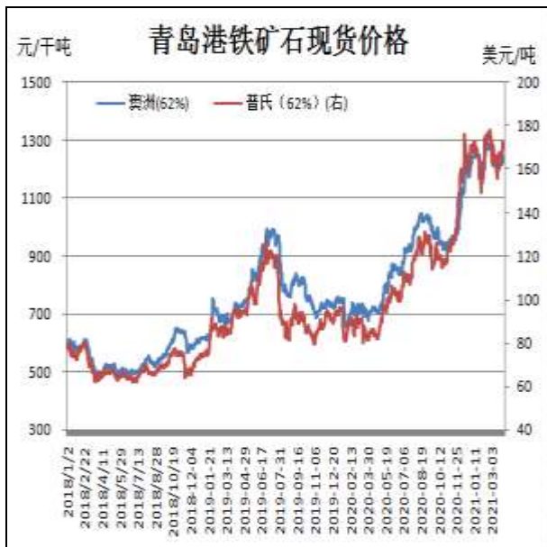
图1：铁矿石现货价格走势