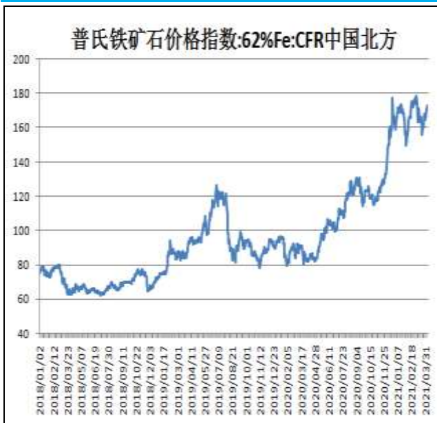
图9：62%铁矿石普氏指数

本周，62%铁矿石普氏指数震荡上行，8日价格为172.15美元/吨，周环比+5.15美元/吨。