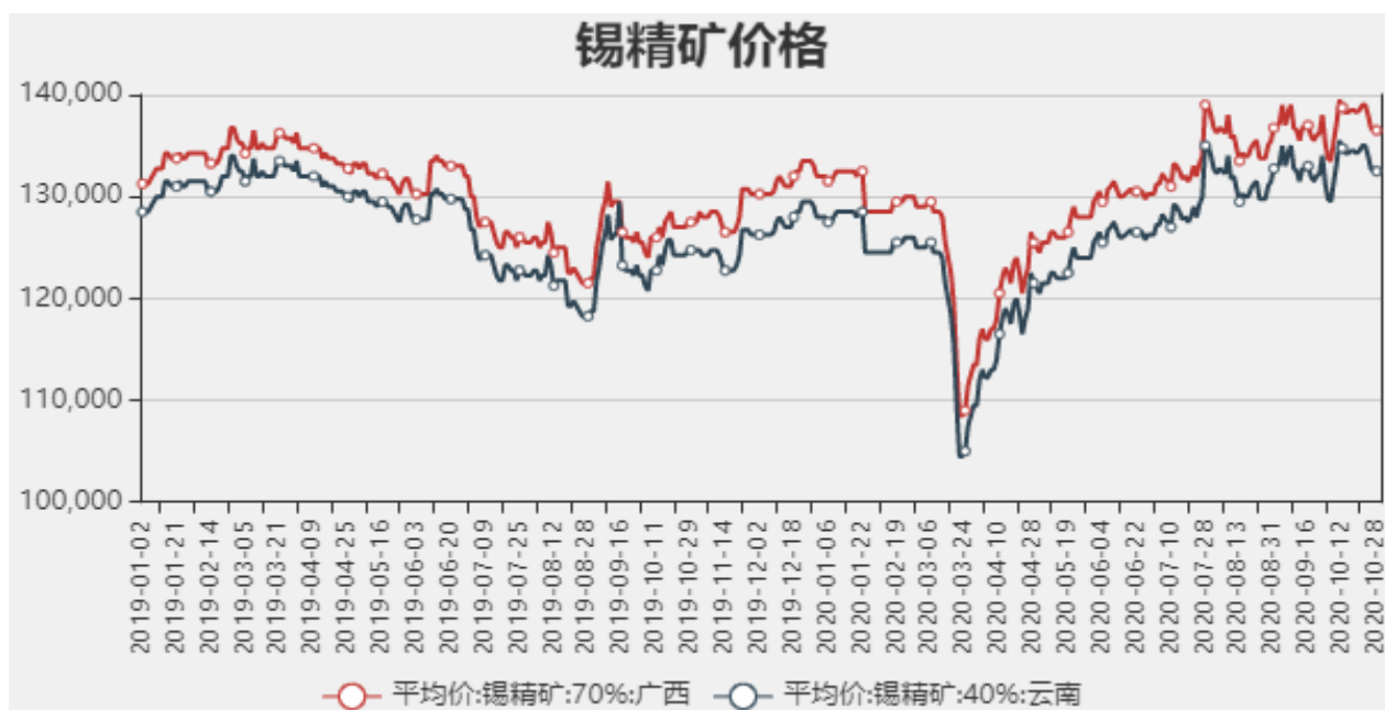
图2：国内锡精矿价格

截止至2020年10月29日，国内广西锡精矿70%价格为136250元/吨，云南锡精矿40%价格为132250元/吨。