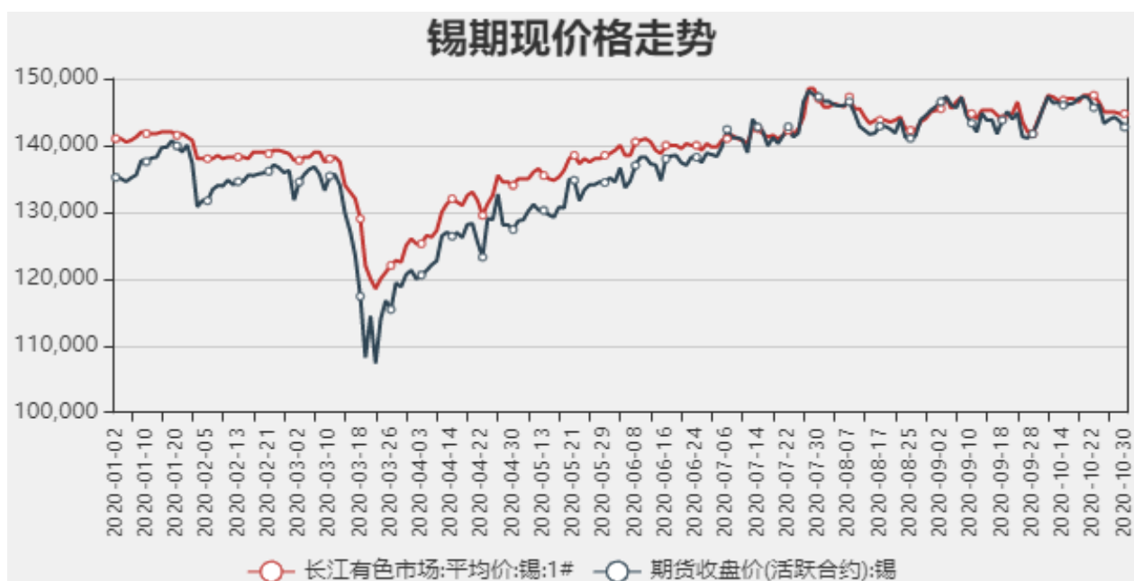
图1：国内锡现货价格

截止至2020年10月30日，长江有色市场1#锡平均价为144750元/吨，沪锡期货价格为142720元/吨。