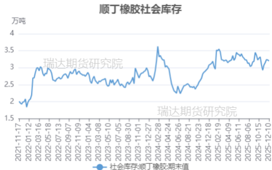
顺丁橡胶社会库存