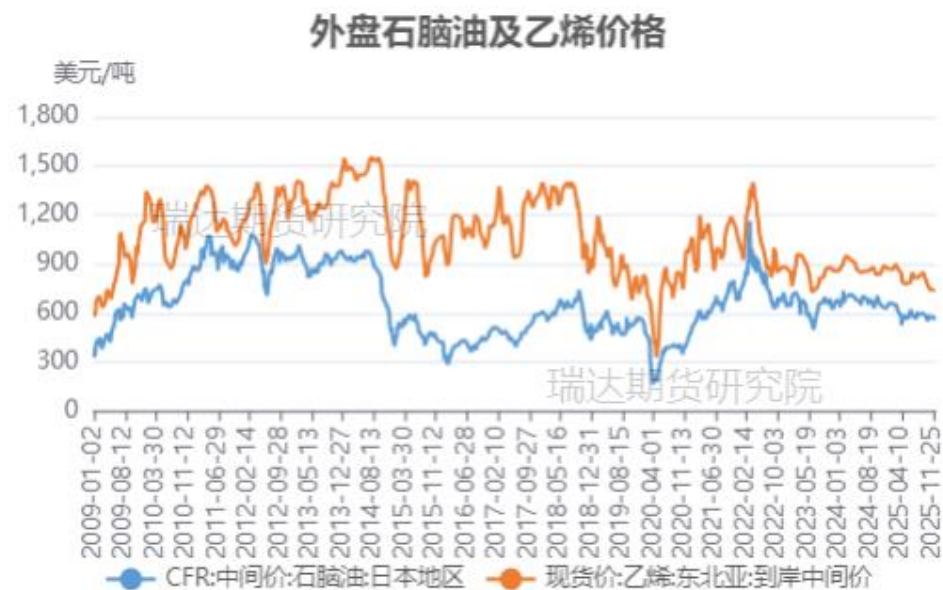
外盘石脑油及乙烯价格走势