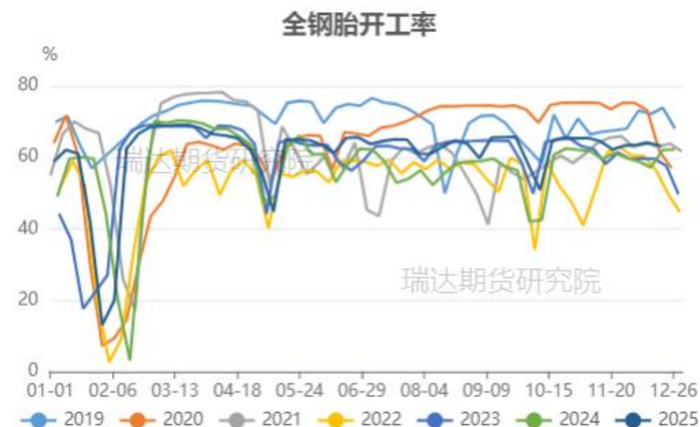
国内全钢胎开工率