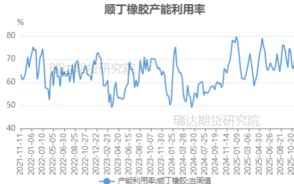
顺丁橡胶产能利用率