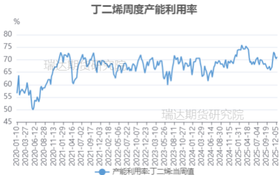
丁二烯周度产能利用率