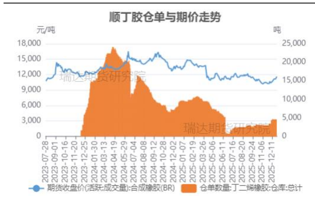
合成橡胶期价与仓单变化对比