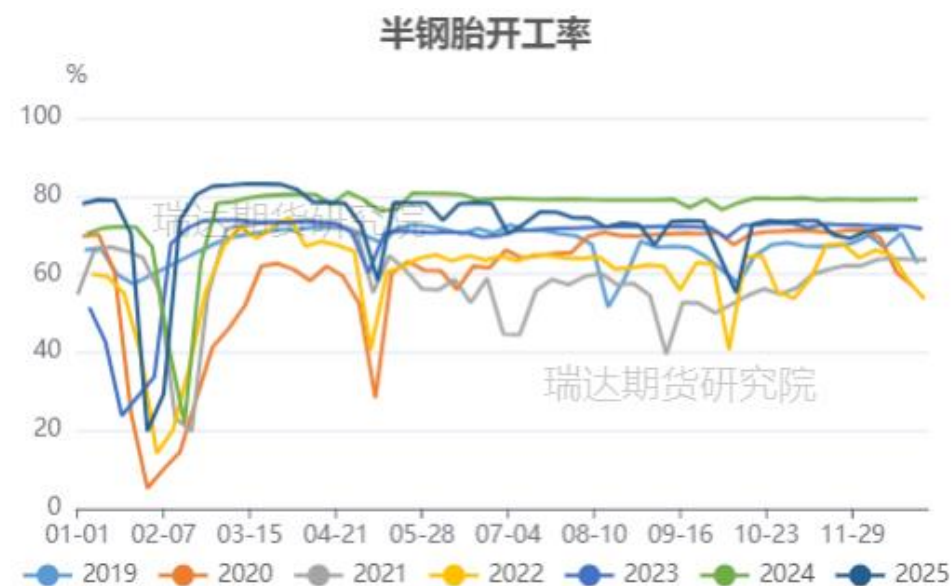
国内半钢胎开工率