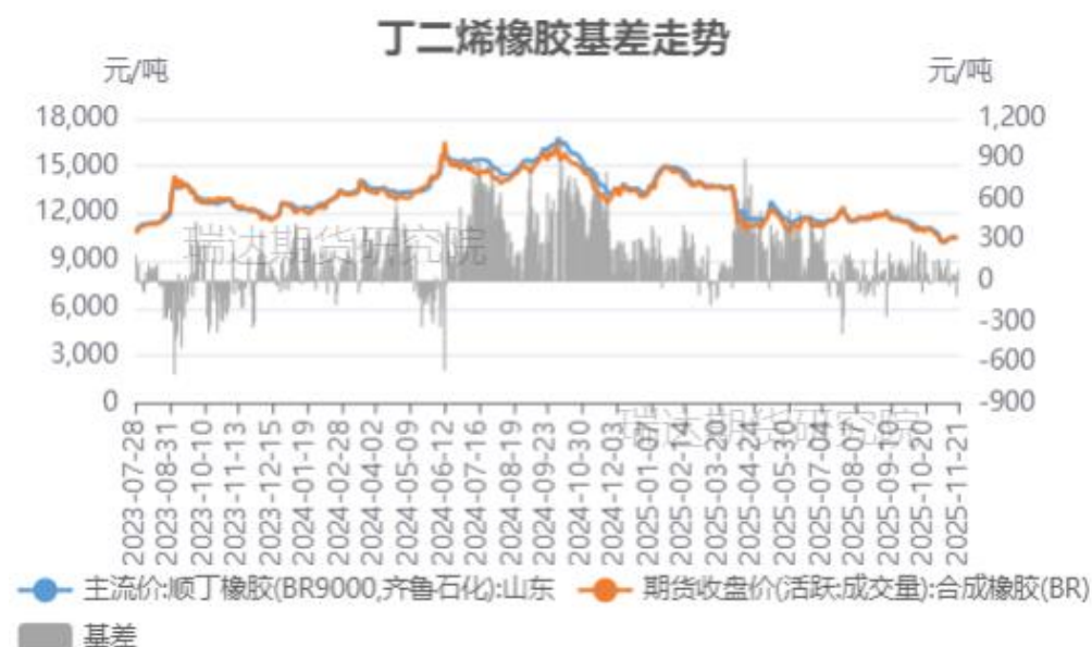
丁二烯橡胶基差走势