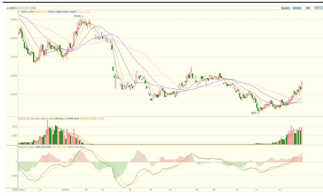
合成橡胶期货主力合约价格走势