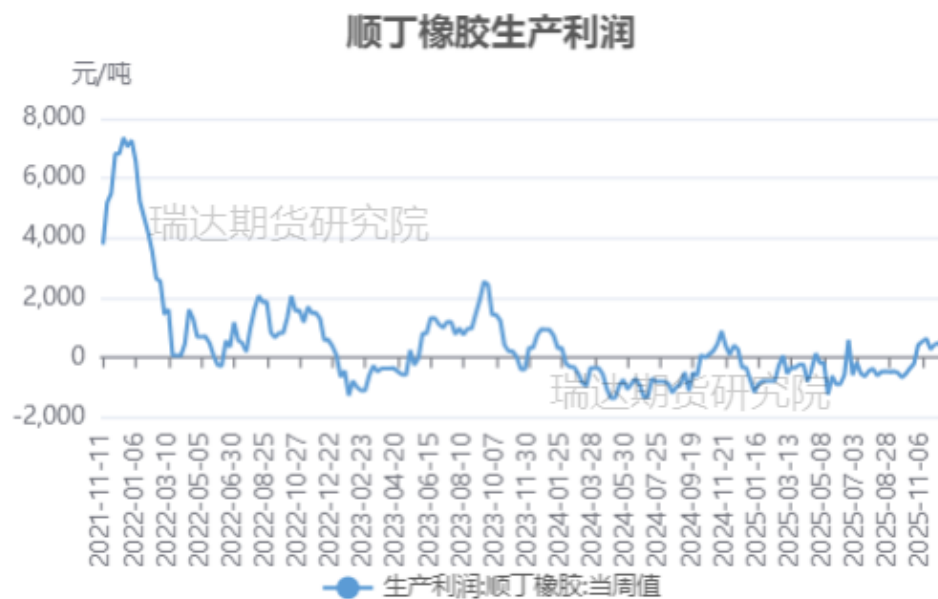
顺丁橡胶生产利润