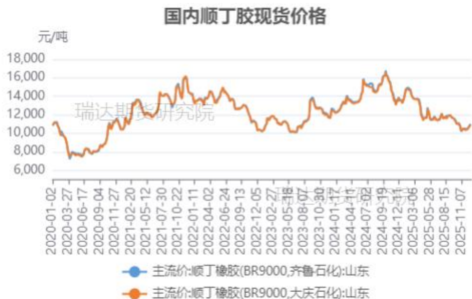
顺丁橡胶现货市场价格走势