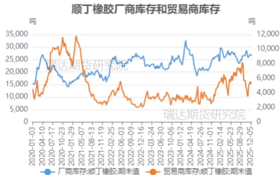
顺丁橡胶厂商库存和贸易商库存