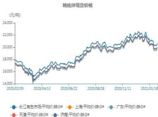
图7：国内锌锭价格走势图