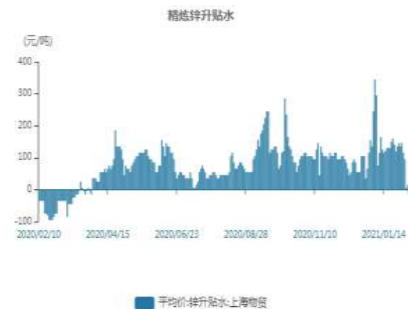
图9：上海精炼锌贴水走势图