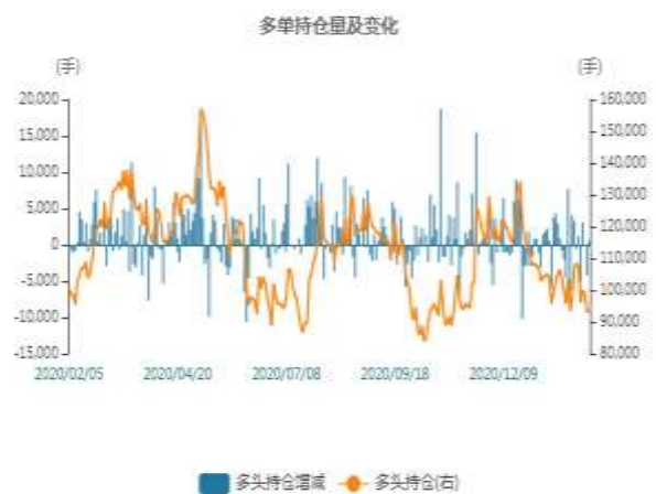
图2：沪锌多头持仓走势图