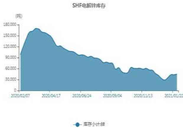
图11：上海锌库存走势图

截止至2021年2月5日，上海期货交易所精炼锌库存为60361吨，较上一周增15615吨。