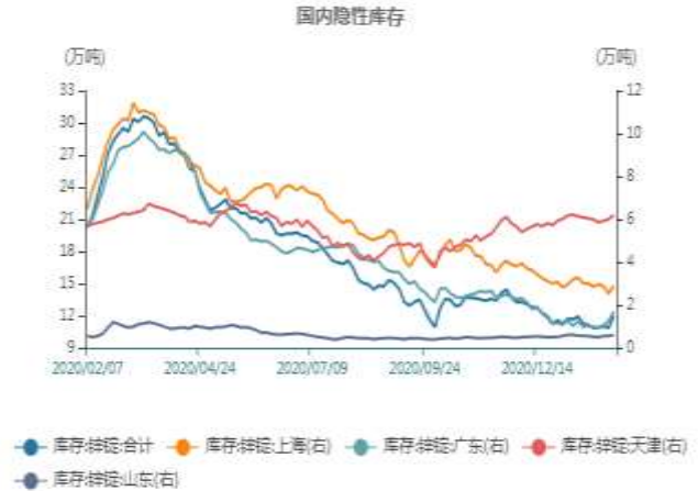
图14：国内隐性库存走势图