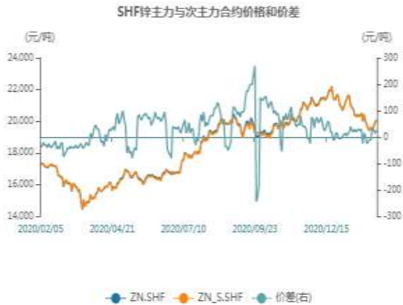
图5：沪锌主力与次主力价差走势图