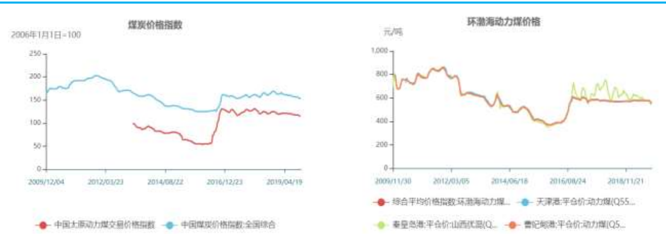
图2：环渤海动力煤价格