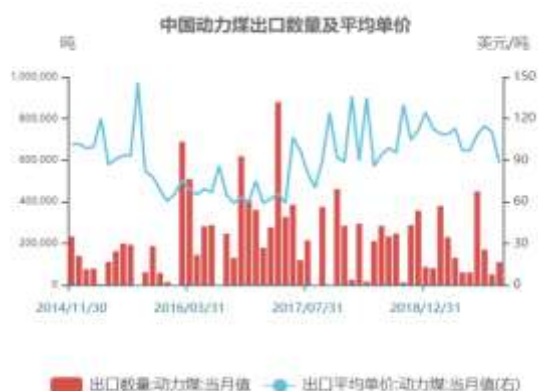
图11：中国动力煤出口数量及平均单价