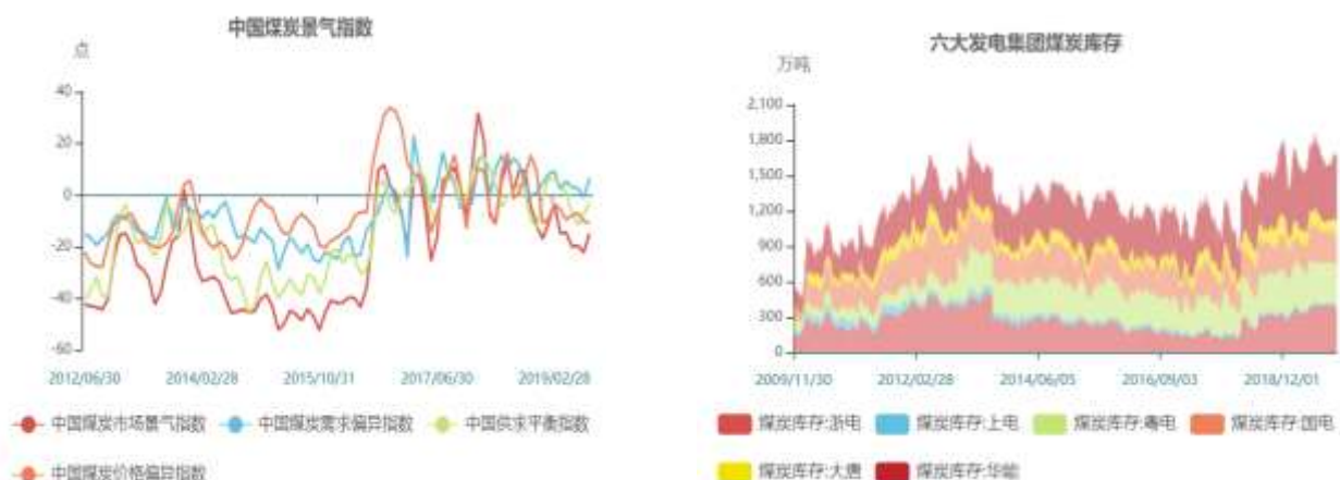
图6：六大发电集团煤炭库存