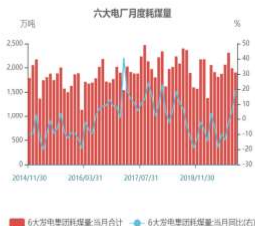
图9：六大电厂月度耗煤量