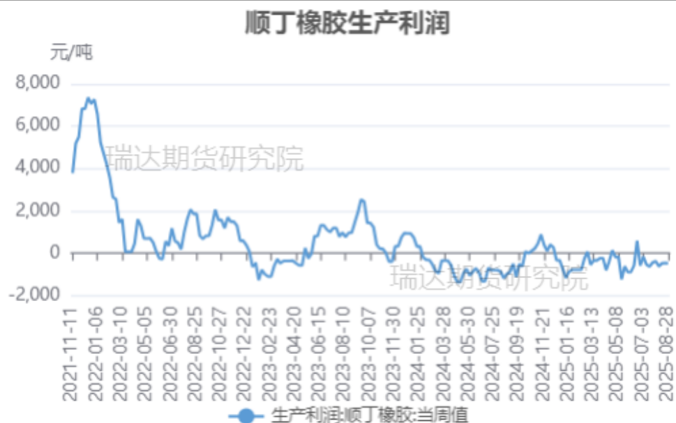
顺丁橡胶生产利润