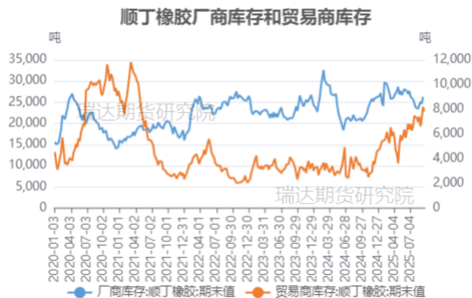
顺丁橡胶厂商库存和贸易商库存