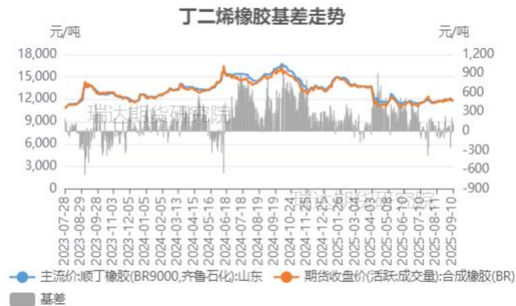
丁二烯橡胶基差走势