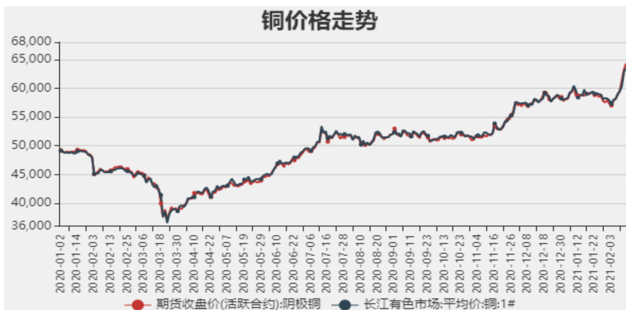
图1：铜期现价格走势

截止至2021年2月19日，长江有色市场1#电解铜平均价为64320元/吨；电解铜期货价格为63480元/吨。