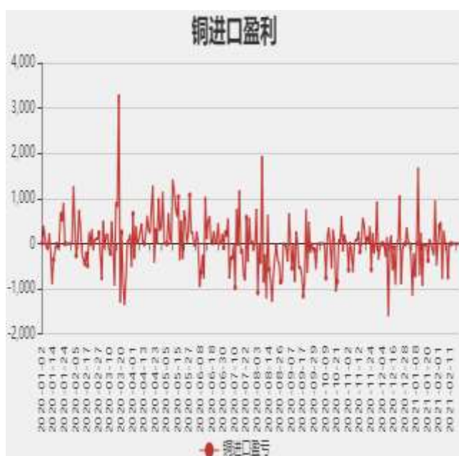
图3：精炼铜进口利润