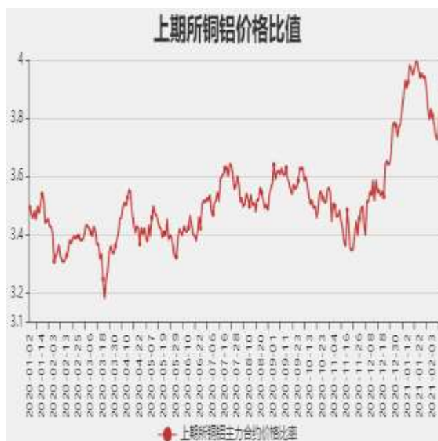
图9：沪铜和沪铝主力合约价格比率