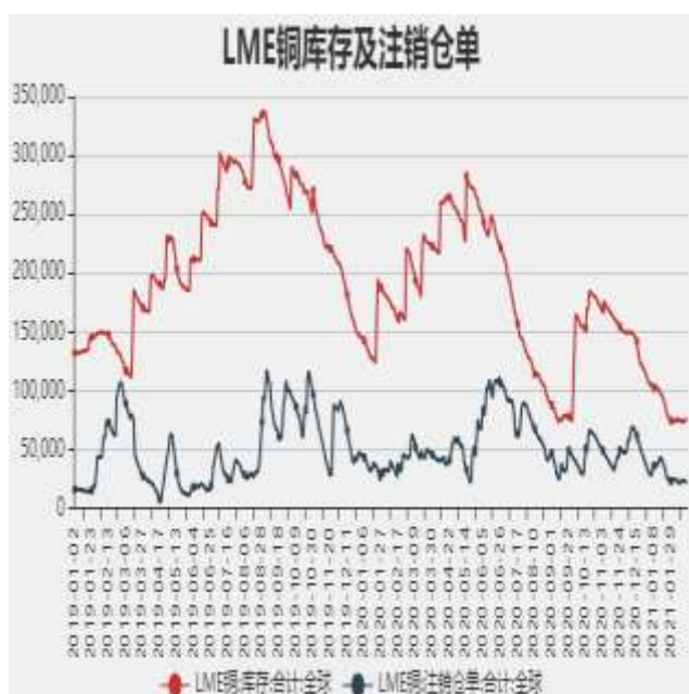
图7：LME铜库存及注销仓单