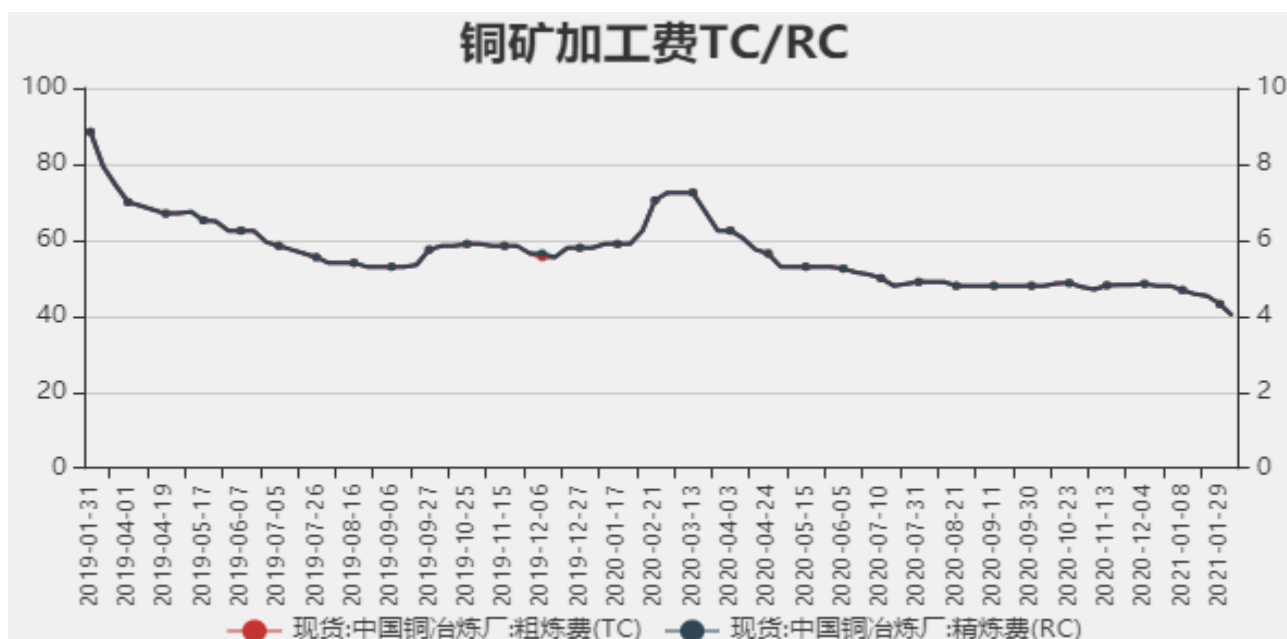
图2：中国铜冶炼加工费

2021年2月5日中国铜冶炼厂粗炼费（TC）为40.1美元/干吨，精炼费（RC）为4.01美分/磅，较上周下调3.1美元/干吨。