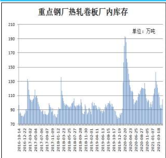
图9：样本钢厂热卷厂内库存

5月20日，据Mysteel监测的全国37家热轧板卷生产企业中热卷厂内库存量为95.68万吨，较上周减2.44万吨，较去年同期减少19.06万吨。