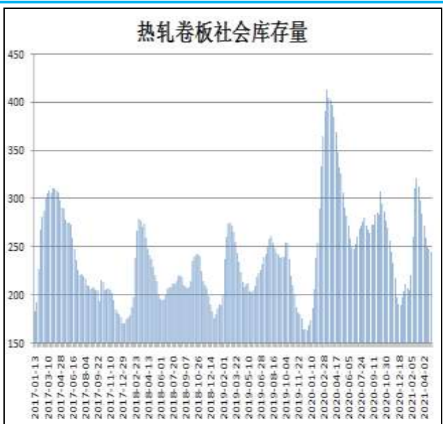
图10：全国33城热卷社会库存

5月20日，据Mysteel监测的全国33个主要城市社会库存为251.40万吨，较上周减少0.08万吨，较去年同期减少39.6万吨。