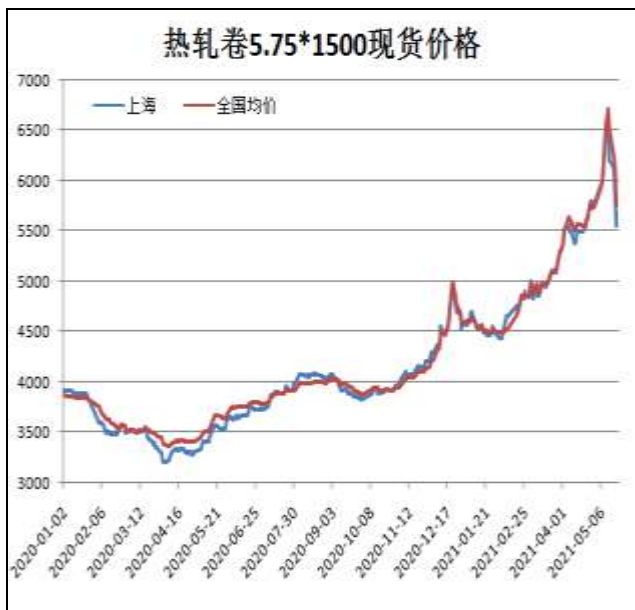
图1：热轧卷板现货价

5月21日，上海热轧卷板5.75mm Q235现货报价为5680元/吨，周环比-520元/吨；全国均价为5758元/吨，周环比-756元/吨。