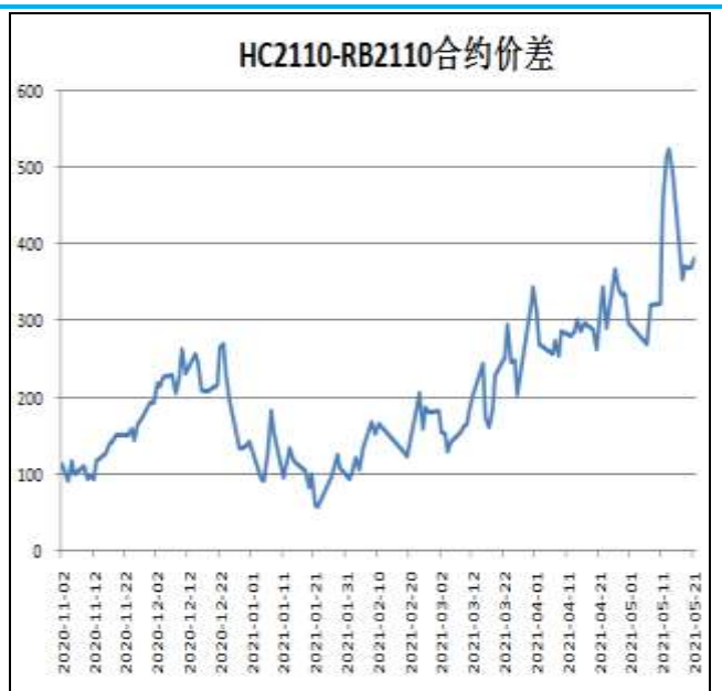
图6：热卷与螺纹跨品种套利

本周，HC2110合约走势弱于RB2110合约，21日价差为381元/吨，周环比-113元/吨。