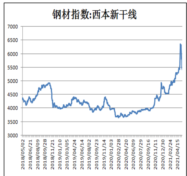
图2：西本新干线钢材价格指数

5月21日，上海热轧卷板5.75mm Q235现货报价为5680元/吨，周环比-520元/吨；全国均价为5758元/吨，周环比-756元/吨。