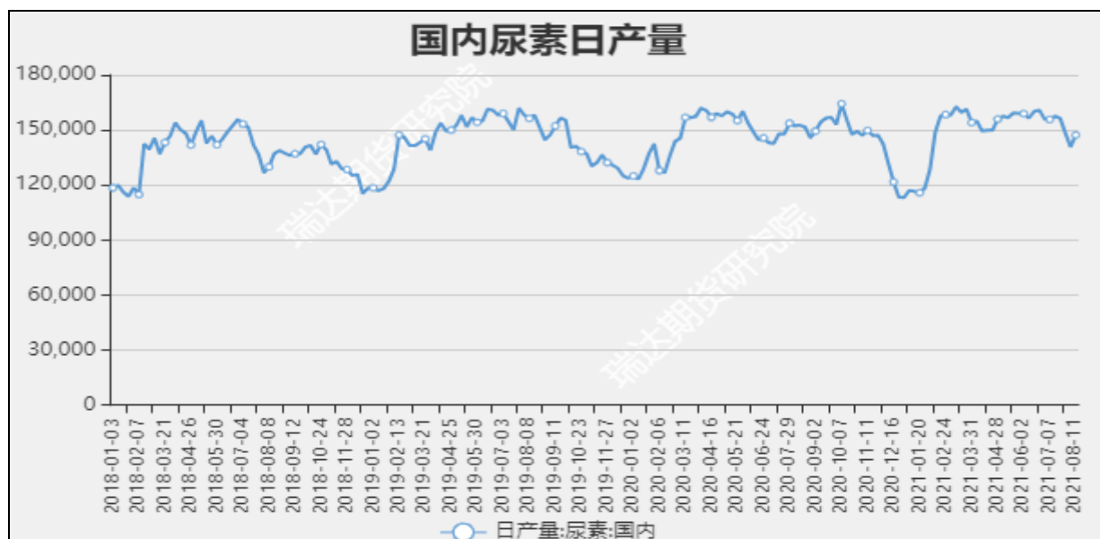
图7 国内尿素日产量