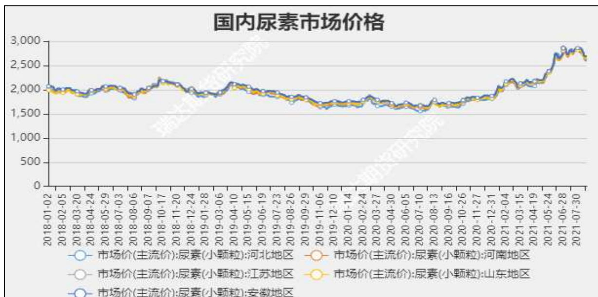
图3 国内尿素市场主流价

截至8月19日，NYMEX天然气收盘价3.86美元/百万英热单位，较上周-0.5美元/百万英热单位。